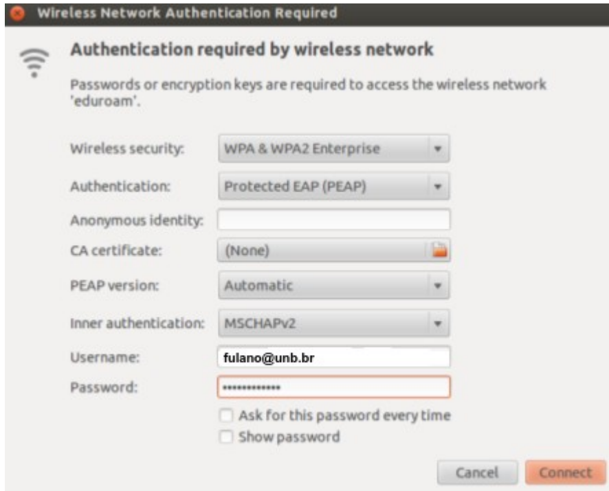
Figura 2 – Configurações para a rede eduroam.

Após clicar em Connect , uma janela aparecerá avisando-lhe que a conexão pode ser segura devido à ausência de um certificado digital. IGNORE O AVISO. A conexão à rede eduroam deverá ser estabelecida com sucesso.