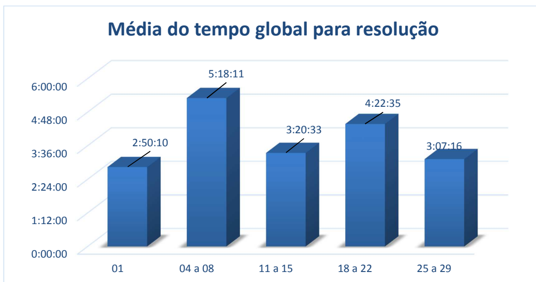
Gráfico04 – Média de tempo global para resolução