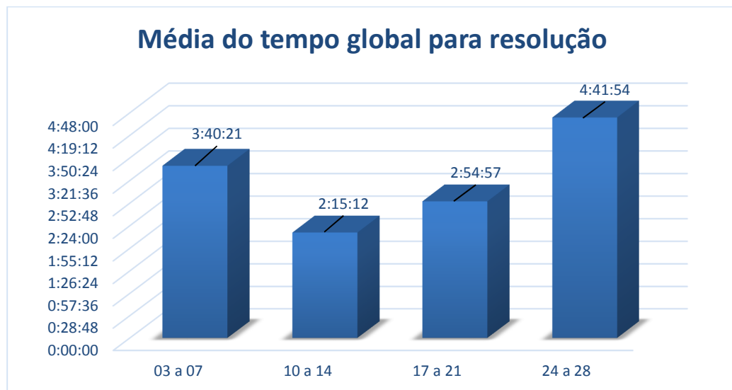
Gráfico04 – Média de tempo global para resolução