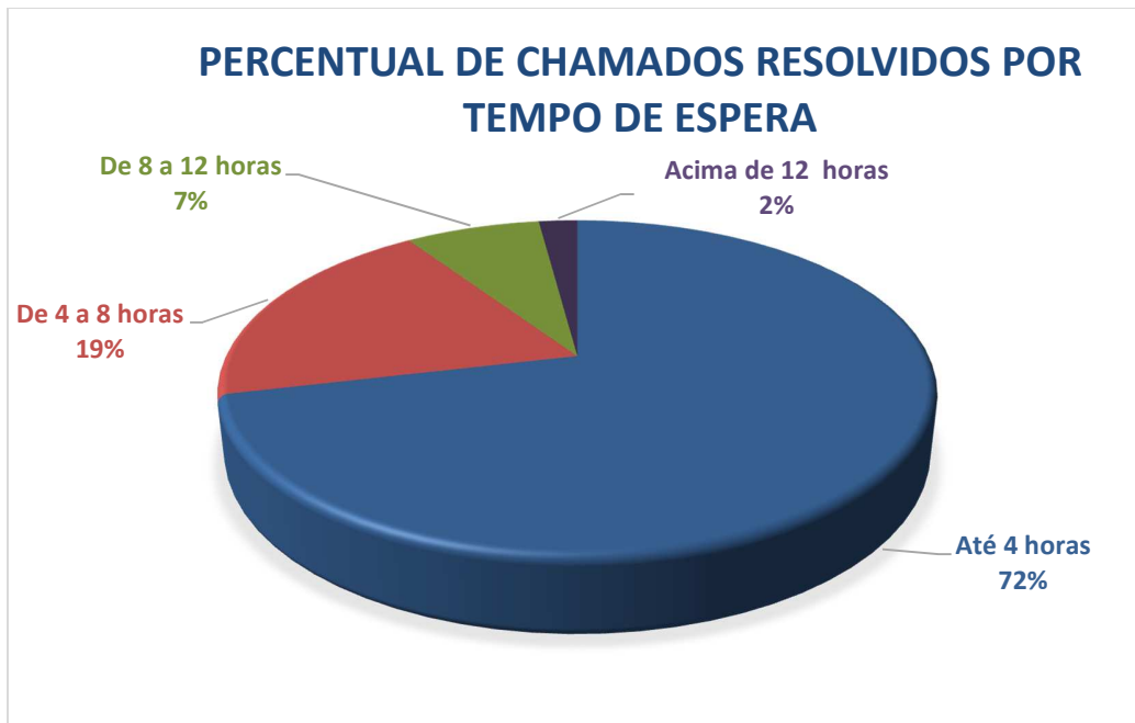
Gráfico05 – Percentual de chamados resolvidos