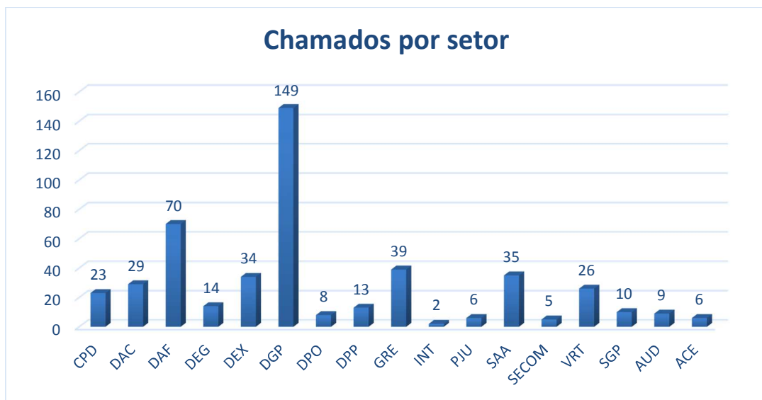
Gráfico02 – Chamados registrados por setor