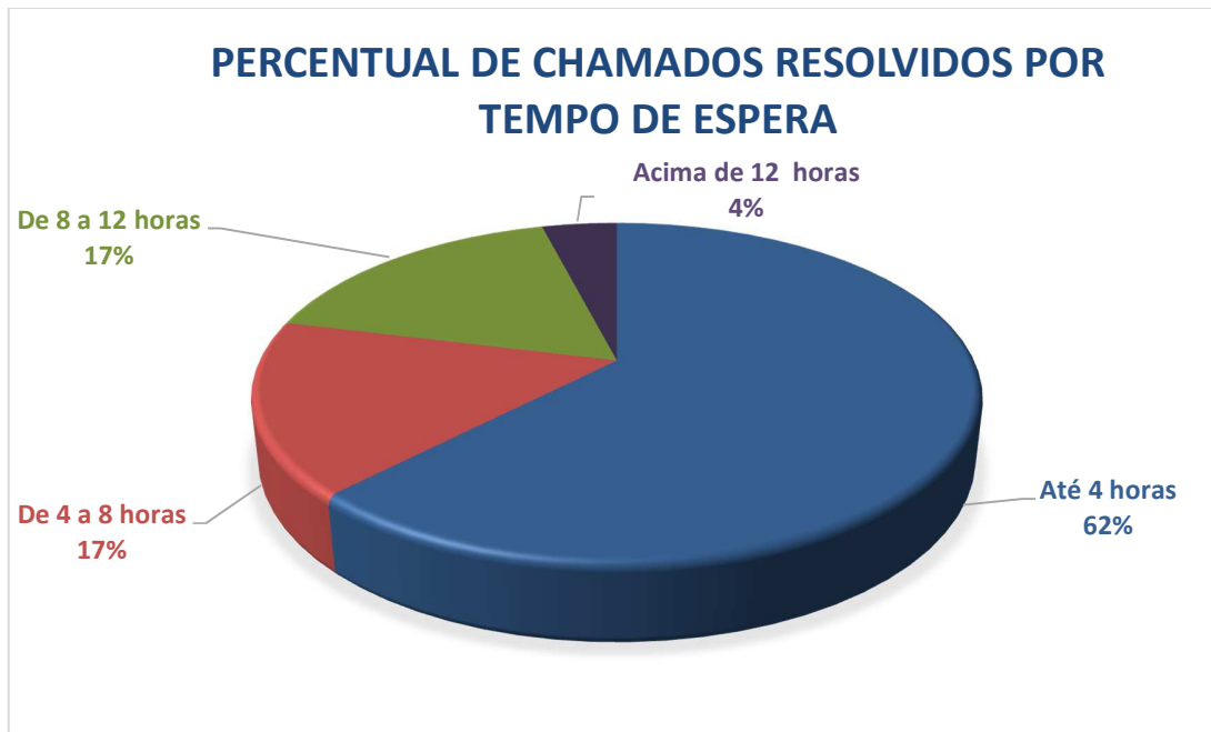
Gráfico 05 – Percentual de chamados resolvidos