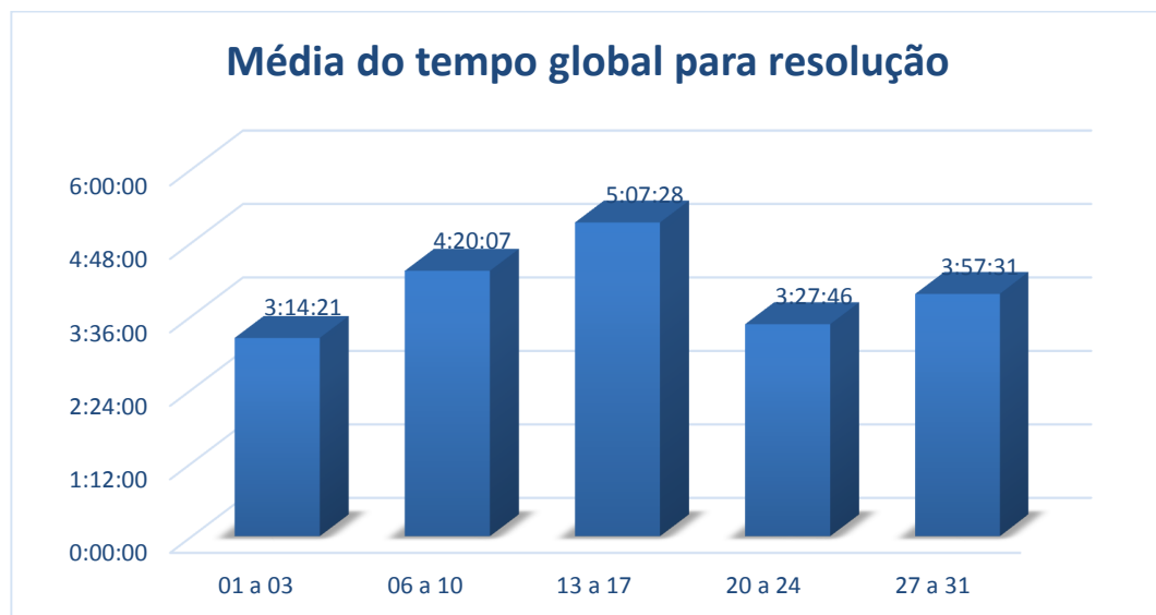
Gráfico 04 – Média de tempo global para resolução