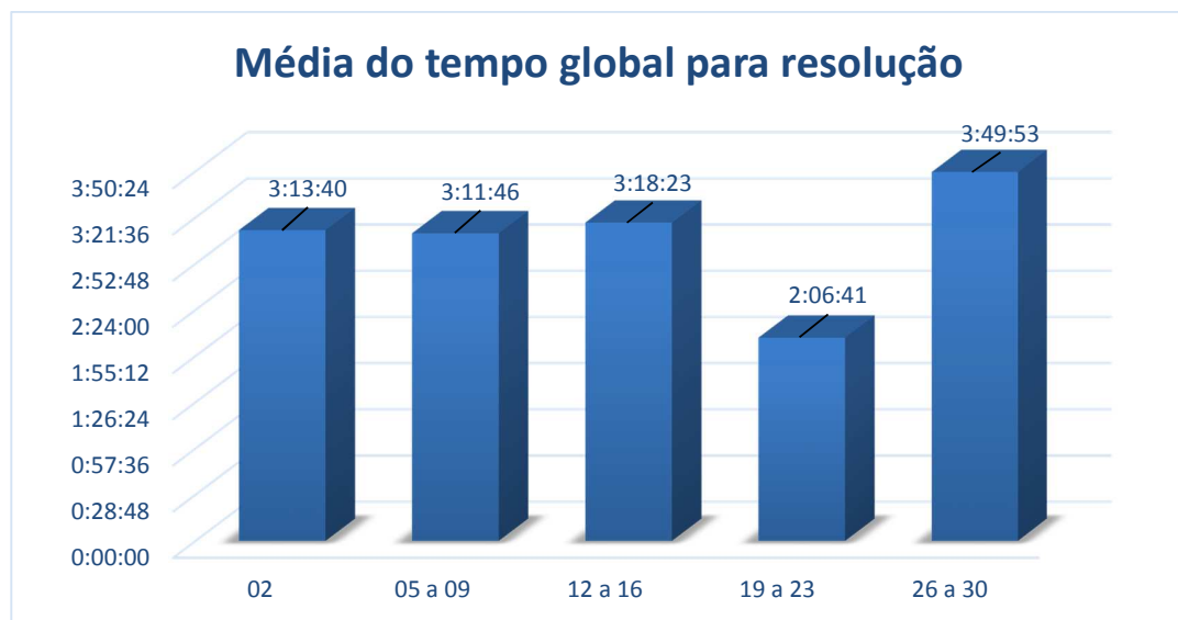
Gráfico04 – Média de tempo global para resolução