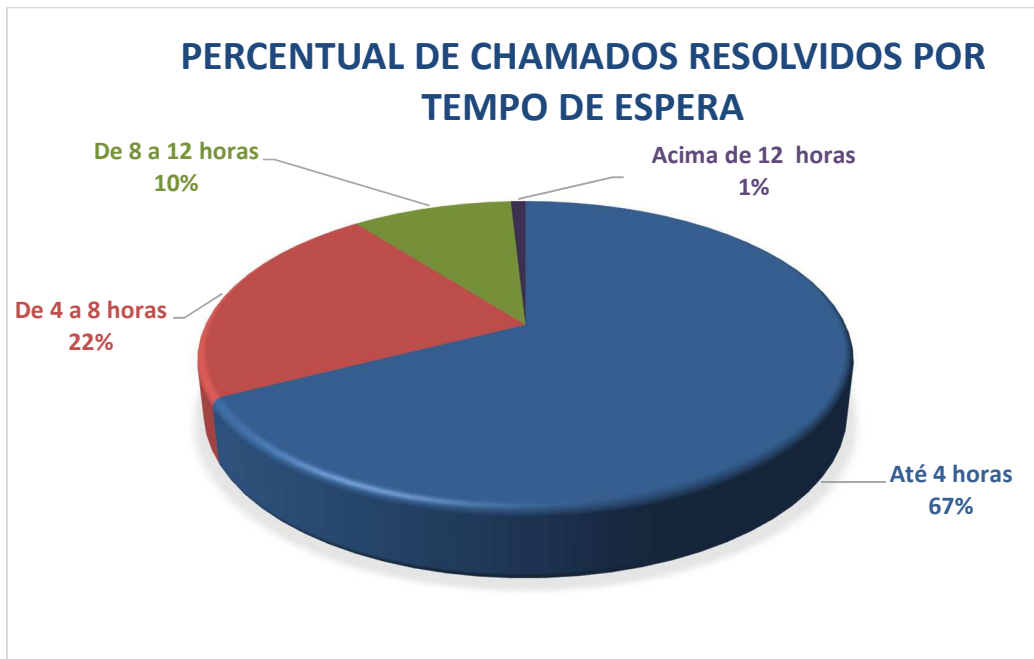
Gráfico05 – Percentual de chamados resolvidos