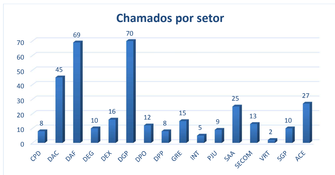
Gráfico02 – Chamados registrados por setor