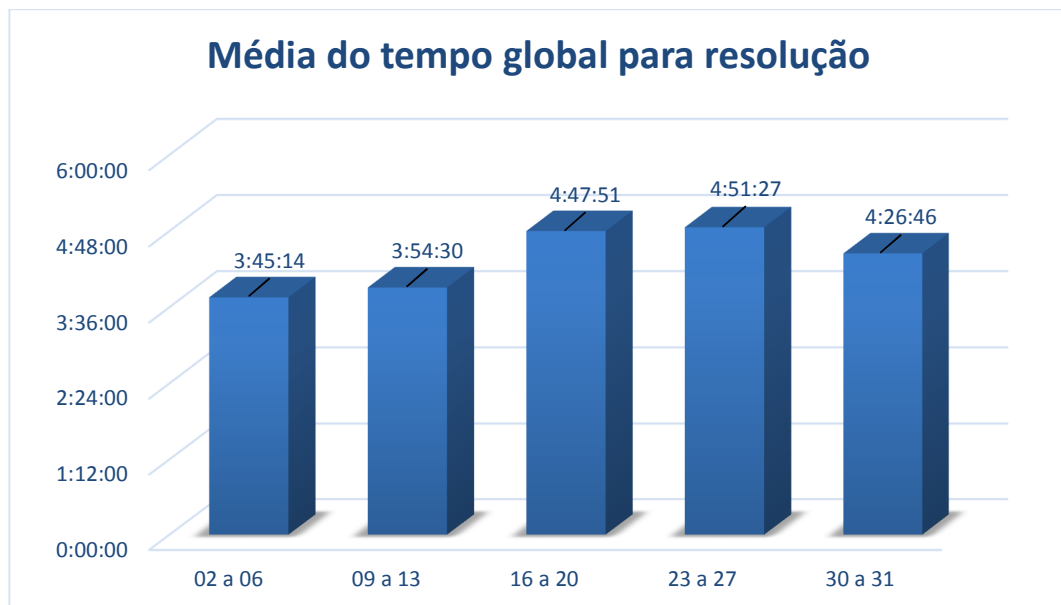
Gráfico04 – Média de tempo global para resolução